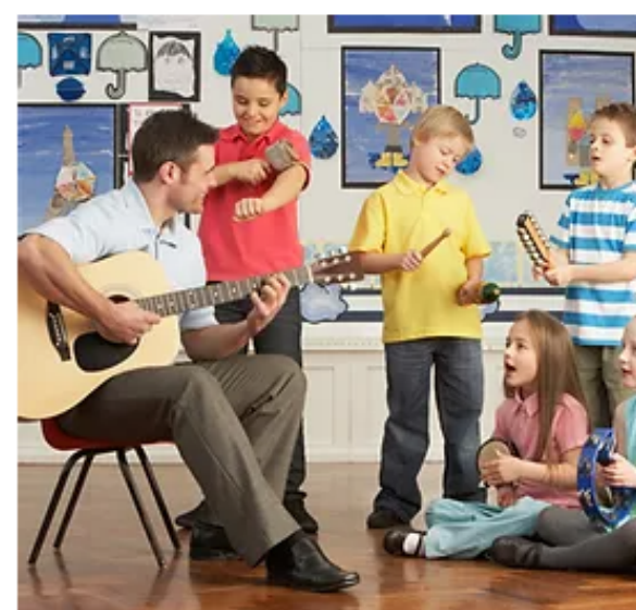
Curso de apreciación musical para niños