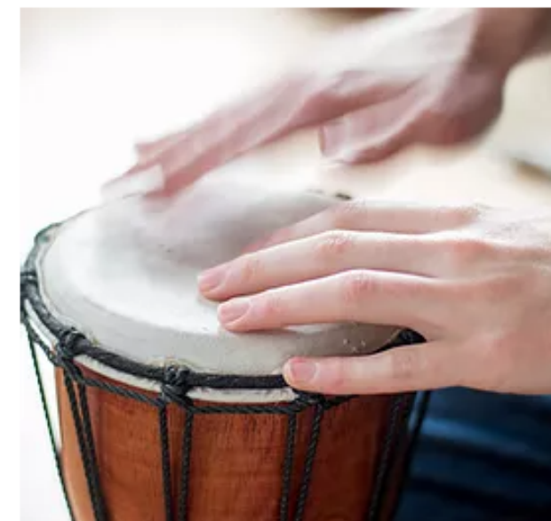
Curso de estimulación musical para el cuidado de las personas de la tercera edad.