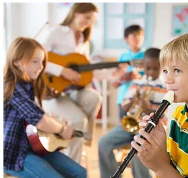
Curso de Pedagogía Música en la escuela.