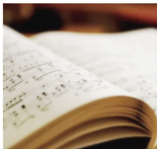
Curso de armonía musical