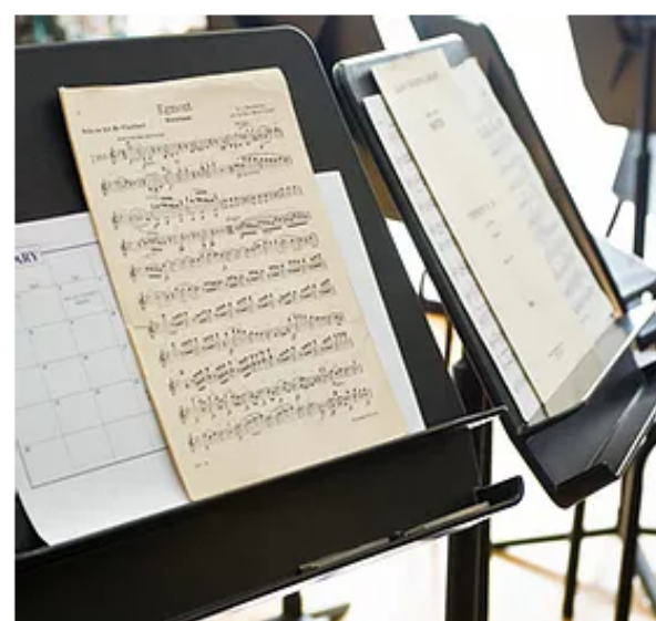
Curso de Teoría musical