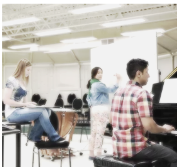
Curso de gestión en proyectos musicales