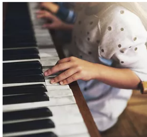
Curso de pedagogía Música en la Educación Especial