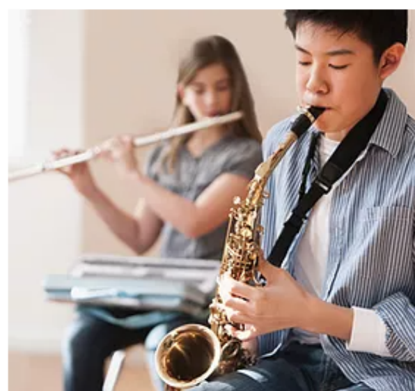
Curso de apreciación musical Jóvenes y adultos.