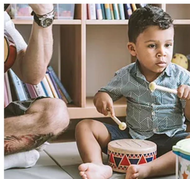
Curso de estimulación musical para bebés.