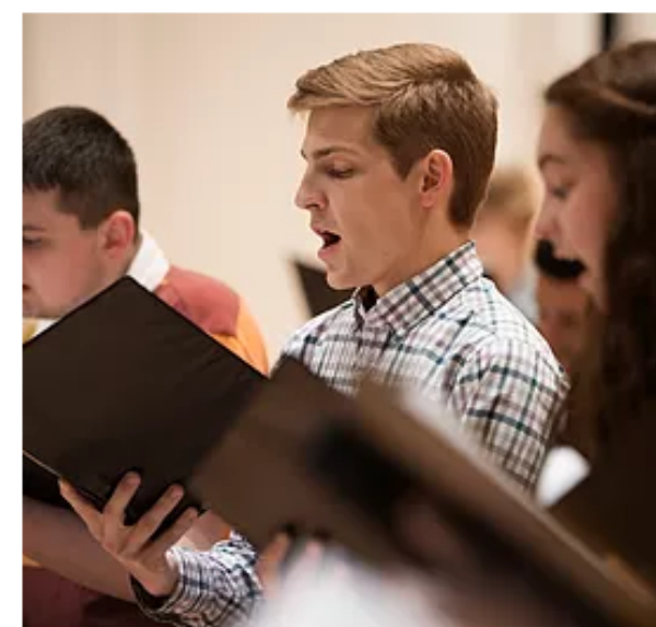
Curso de educación musical para adultos