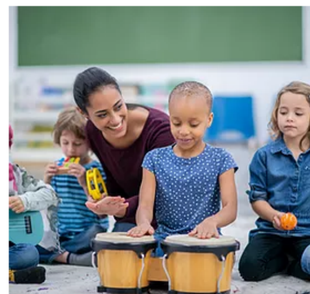
Curso de Musicoterapia