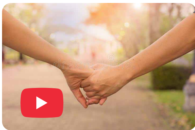
Música para solucionar problemas y tener claridad mental